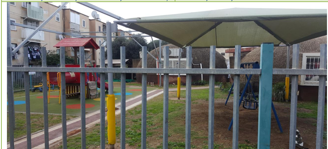
מבט כניסה לגן צבר

קריית אתא ישראל טל: 0544582237 טלפקס' 04-8442978 דוא"ל: darrom1@013net.net